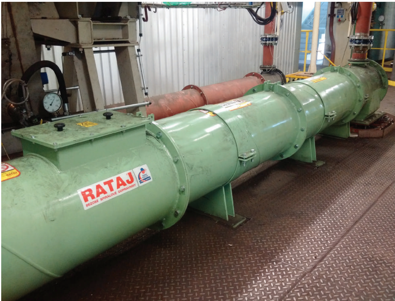
V současnosti nespolehlivější řešení dopravy černouhelného prachu do kotle - dopravník s čedičovou výstýlkou a elektrochemicky leštěnou bezosou spirálou RATAJ

Základním prvkem bezosých spirálových dopravníků RATAJ® je bezosa spirála vyrobená z prvotřídní oceli nebo nerezové oceli o tloušťce 3 až 60 mm a vnějším průměru 25 až 800 mm. V bezosém spirálovém dopravníku nejsou vnitřní ložiska ani vnitřní hřídel a dopravovaný materiál se pohybuje téměř v celém průřezu dopravníku. Bezosa spirála svým přesně definovaným průřezem a otáčejícím se pohybem umožňuje dopravovat velké množství materiálu při malých otáčkách a při minimální spotřebě elektrické energie nebo naopak velmi malé množství materiálu pro účely dávkování.